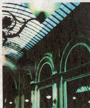
Galerie Lafayette? Nein, Palais Ferstl im 1. Bezirk. [A. Michel]

Davon profitieren auch die Kaufleute. Ergänzend zu den Fotos liegen in fast allen Geschäften Info-Folder mit abtrennbaren Postkarten auf. „So kommt der Kunde ins Geschäftslokal und Michels Fotokunst in die ganze Welt.“